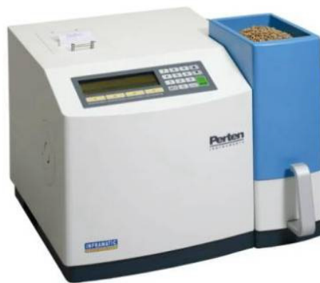
Ganzkorngerät IM 9200: